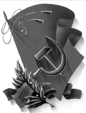
Слава Великой Октябрь!

Ровно сто лет отделяют нас от этой даты, которая определила судьбы многих народов. Но несмотря на глобальные изменения, произошедшие за последние десятилетия в политической жизни нашей страны, и сегодня Октябрьская революция не утрачивает своего значения как знаменательное событие мировой истории.