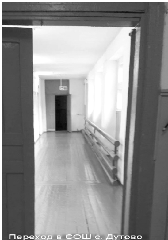
Переход в СОШ с. Дутово