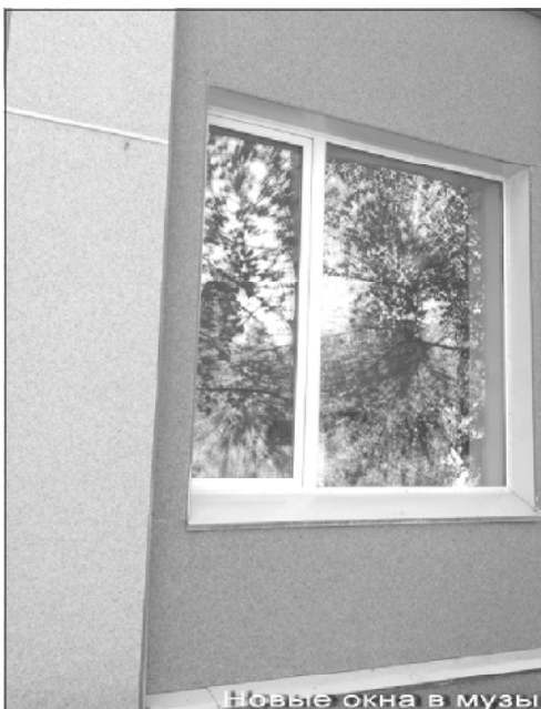
Новые окна в музыкальной школе

ней школе с. Дутово идет косметический ремонт помещений, покрашены туалет, переход, пожарный выход, заменены окна в кабинетах. Также во всех учреждениях проводится косметический ремонт: покраска лестничных маршей, санузлов, пандусов. Кроме того, в рамках подготовки к работе в осенне-зимний период проведены гидравлические испытания систем теплоснабжения, их промывка, опрессовка практически во всех учреждениях социальной сферы.