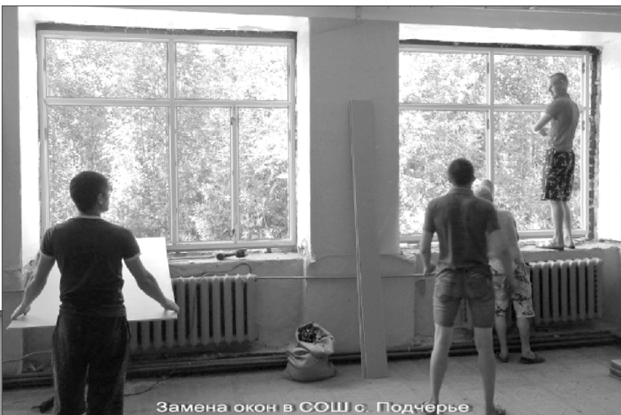
Замена окон в СОШ с. Подчёрье

ченко» заканчивается ремонт ограждения, ремонтируется помещение библиотеки. В МБОУ «СОШ №1» проведено обследование крыши специалистами из г. Ухты, в соответствии с актом будут запланированы ремонтные работы и определен необходимый объем финансовых средств. В подчёрской средней школе началась замена деревянных окон, в МБДОУ «Д/с «Золотой ключик» проведены все подготовительные работы для установки новых окон в 2-х группах. В этом году, к радости пловцов и просто любителей плавания, запланирован и проводится ремонт бассейна МБОУДО «КДЮСШ». Произведен демонтаж покрытия чаши ванны, ожидается приезд специалистов из г. Кирова для установки нового оборудования и нового покрытия. Начаты ремонтные работы 2-х санузлов в МБОУДО «ЦВР», в сред-