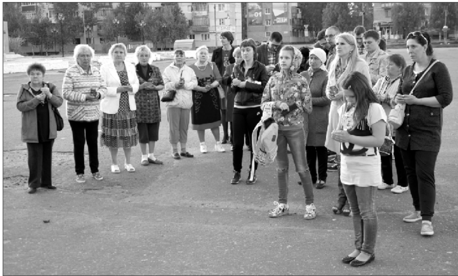
лами - везде, где помнят и чтят подвиг бойцов, сражавшихся со страшным врагом человечества - фашизмом.

Впервые акция "Свеча памяти" прошла в 2009 году по инициативе общественной группы и сразу же встретила широкий отклик в российском обществе. При народной поддержке акцию решили проводить каждый год. За эти восемь лет к ней присоединились более 3000 городов и населенных пунктов, как в России, так и за её преде-