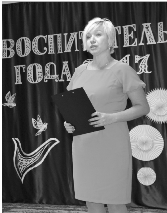
тель-логопед детского сада «Золотой ключик» (высшее профессиональное образование, стаж работы – 11 лет). (Окончание на 2 стр.)