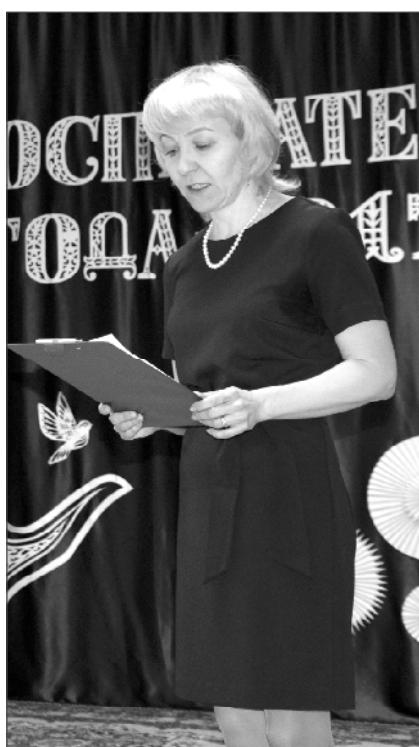
(Окончание. Начало на 1 стр.)