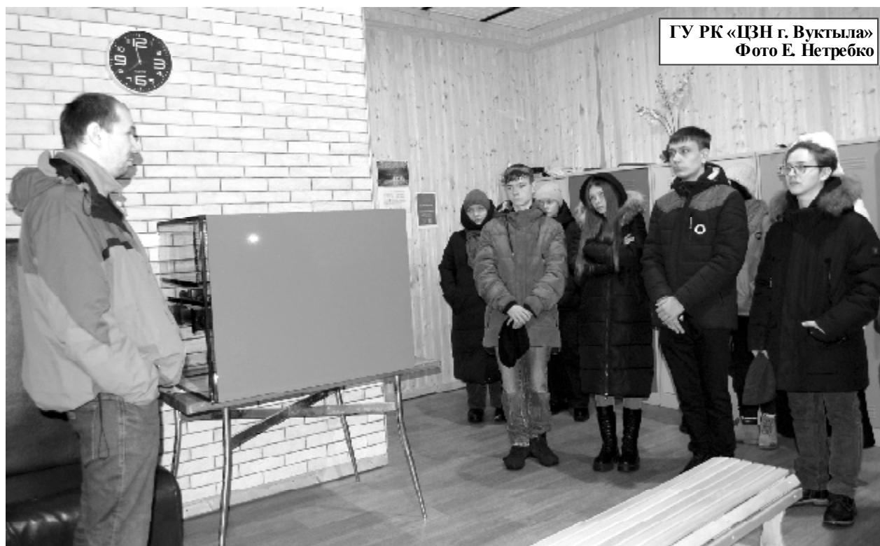
ГУ РК «ЦЗН г. Вуктыла»