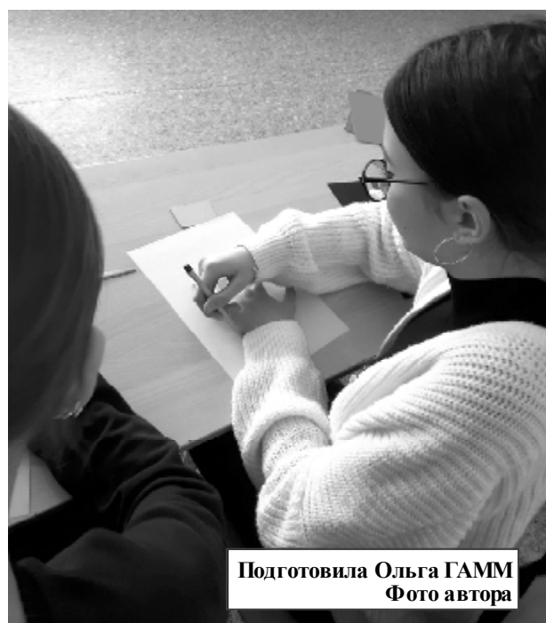
Подготовила Ольга ГАММ

В школах тоже очень часто встречается проблема межличностных отношений, в основе которых часто лежат явления нетерпимости. Проживание в мире и согласии предполагает наличие у каждого таких человеческих качеств как взаимопонимание, взаимоуважение,