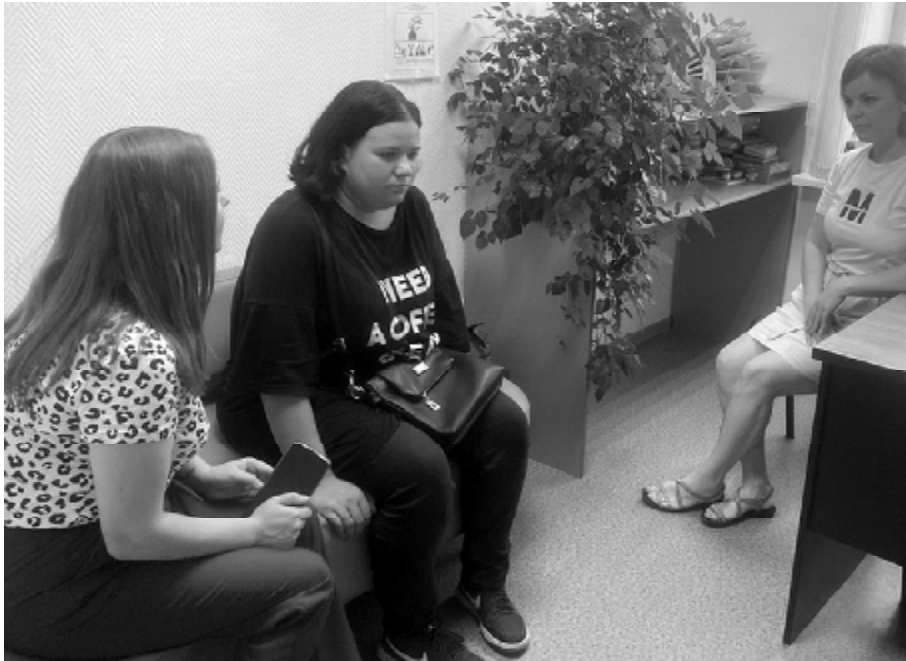
ЦСЗН г. Вуктыла

В рамках Недели правовой грамотности с специалистами Комплексного центра социальной защиты населения города Вуктыла 8 августа организована встреча с лицами из числа детей-сирот и детей, оставшихся без попечения родителей. В ходе встречи специалисты обсудили вопросы соблюдения прав и интересов молодой семьи, прав детей и детско-родительских отношений, напомнили о том, какие меры воздействия предусмотрены за ненадлежащее исполнение родительских обязанностей и жестокое обращение с ребенком.