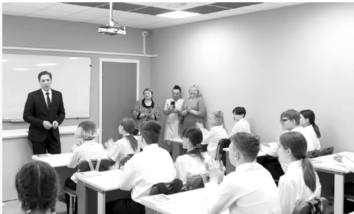
На средства марафона обновили кабинет физики в школе № 1 г. Вуктыла

2 мероприятия проведено для помощи людям, попавшим в трудную жизненную ситуацию