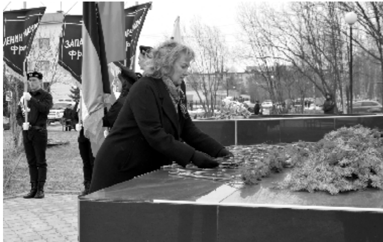
(Окончание. Начало на 1 стр.)