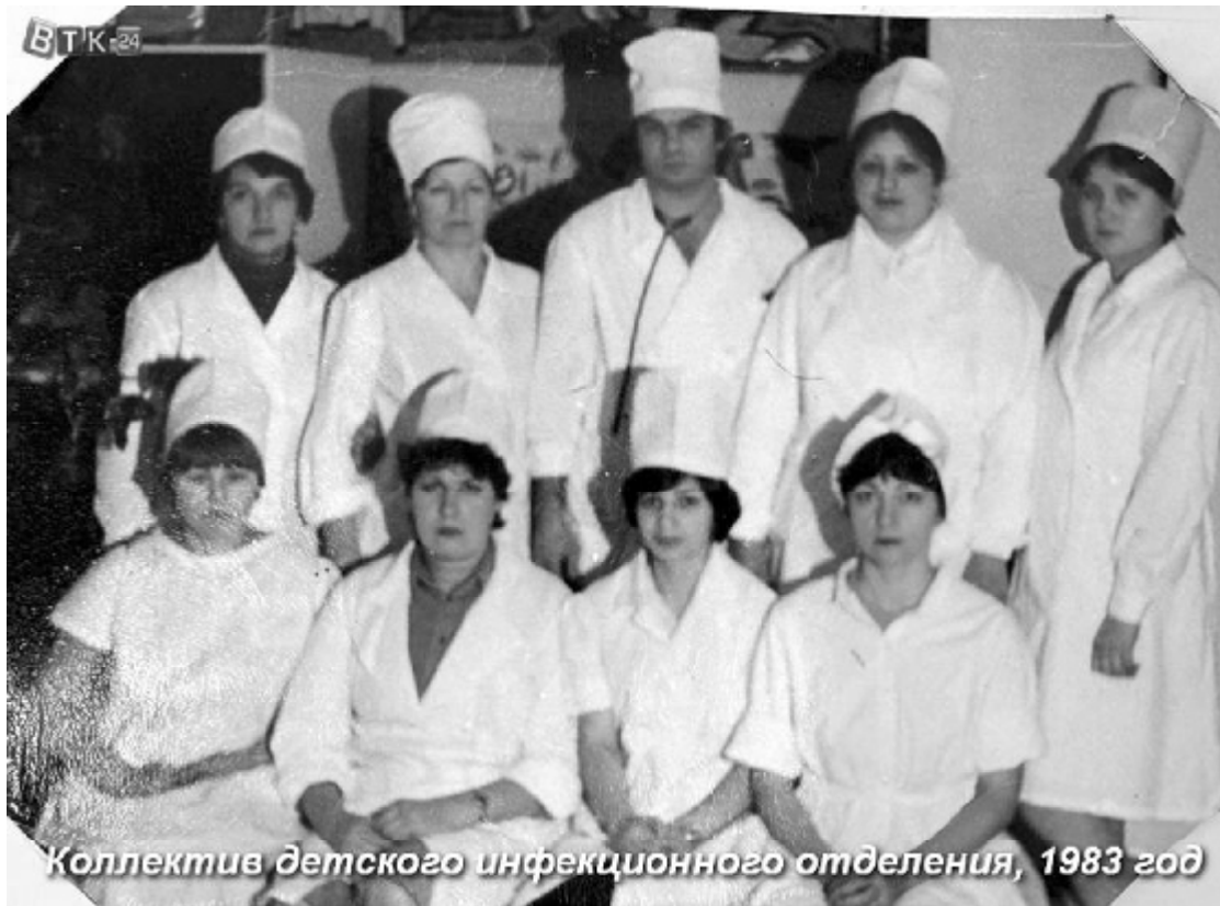
Коллектив детского инфекционного отделения, 1983 год

Профсоюзный комитет от всей души поздравляет коллектив Вуктыльской центральной районной больницы с юбилеем! «Желаем нашей больнице привлечь еще много молодых и грамотных специалистов. Крепкого здоровья всем нашим ветеранам, всем, кто сегодня стоит на страже здоровья жителей муниципального округа. Удачи и реализации новых планов всем нашим сотрудникам! Пусть наша больница обновляется, развивается и трудится на благо жителей!», – отмечает Вера Зайцева.