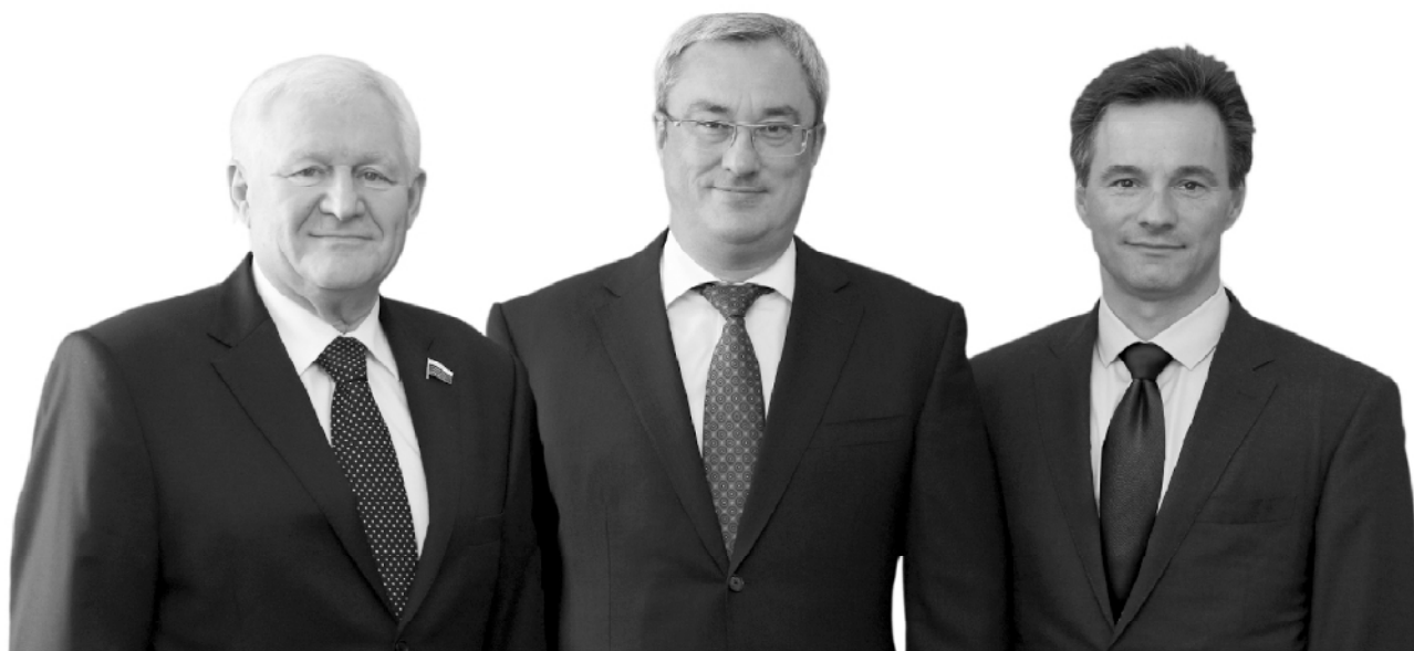
Владимир ПОНЕВЕЖСКИЙ депутат Государственной Думы от Республики Коми