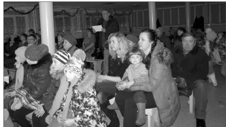
(Окончание. Начало на 1 стр.)

большую». Немного официально в праздничную атмосферу внесла глава администрации сельского поселения «Ду-