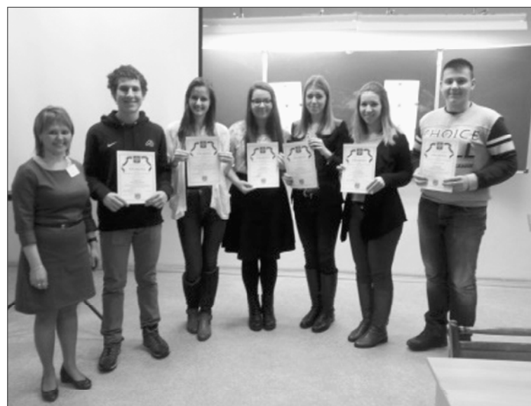
Сроки проведения регионального этапа всероссийской олимпиады школьников по общеобразовательным предметам в 2014/15 учебном году

культуре, экономике, математике, экологии, праву, немецкому языку и технологии. Министерство образования РК