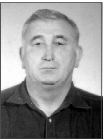
Жена, дети, внуки