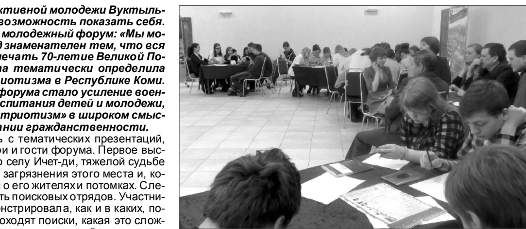
Участниками конкурса стали: Совет молодых специалистов муниципального района Вуктыл, Федерация детских объединений «РИТМ» в состав которой входят: детское объединение «Ровесник» средняя общеобразовательная школа №1, детское объединение «СМИД» средняя общеобразовательная школа №2 имени Геннадия Викторовича Кравченко, детское объединение «Мы вместе» средняя общеобразовательная школа села Дутово, детское объединение «Родник» средняя общеобразовательная школа села Подчерье.

Выступление жюри окончилось викториной на тему выборов. Каждому участнику были выданы бланки с вопросами, которые потом были сданы, объединение набравшее большинство правильных ответов получило диплом.