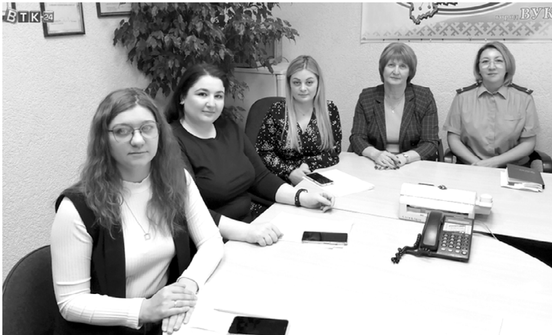
17 ноября в Общественной приемной Главы Республики Коми по городу Вуктылу прошла «прямая линия» на тему: «День правовой помощи детям: вопросы и ответы» с участием нотариуса и представителей субъектов профилактики безнадзорности и правонарушений несовершеннолетних.