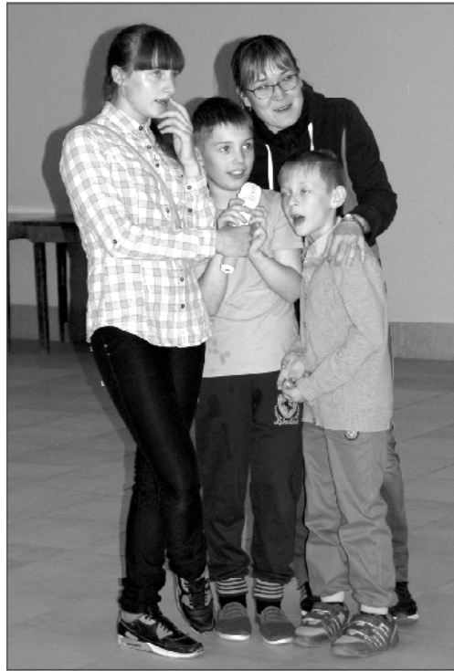
(Окончание. Начало на 1 стр.)

отмечены ученики, принимавшие активное участие в общественной жизни школы, отличившиеся в спорте и своими художественными достижениями. Танцевальные номера-подарки представили юные участницы центра современной хореографии «Аллегрэ».