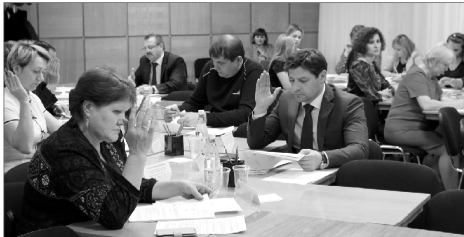
(Окончание. Начало на 1 стр.)

В Совет поступило обращение от сотрудников аэропорта, которые жалуются на отсутствие отопления на 2-м и 3-м этажах здания: в помещениях 8-10 градусов, и не только люди, но и тех-