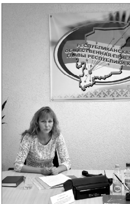
Как пояснила С.Косторниченко, центр «Мои Документы» предоставляет такую услугу. Законный представитель ребенка может, оплатив государственную пошлину за выдачу повторного свидетельства, обратиться в центр с соответствующим заявлением.

В ходе «прямой линии» также был задан вопрос по поводу получения дубликата свидетельства о рождении ребен-