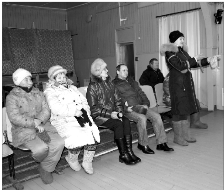
(Окончание. Начало на 3 стр.)

тальный ремонт и многие другие. Жители попросили главного врача проследить, чтобы в посёлке своевременно появлялась информация о приезде в Вуктыл специалистов из г. Сыктывкара. Сельчан интересовало, что можно сделать, чтобы в помещении почты стало теплее. Был вопрос и по поводу пустующих квартир. Квартиры принадлежат владельцам, которые прожива-