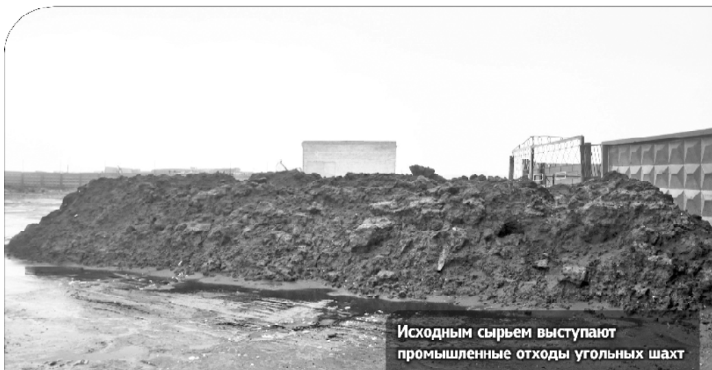
Исходным сырьем выступают промышленные отходы угольных шахт

В этом году в Заполярье заработало производство топливных брикетов из промышленных отходов - угольного шлама, остающегося после добычи и переработки угля. Правда, процессу такого превращения уже не один десяток лет, но именно на воркутинском предприятии «Инновационные технологии «Северная Русь» научились делать угольные брикеты без использования связующего вещества. Обычно цена такого скрепляющего компонента составляет 70-80 процентов от себестоимости. Воркутинцы же совместно с учёными технологических институтов бились над совершенствованием технологии несколько лет.