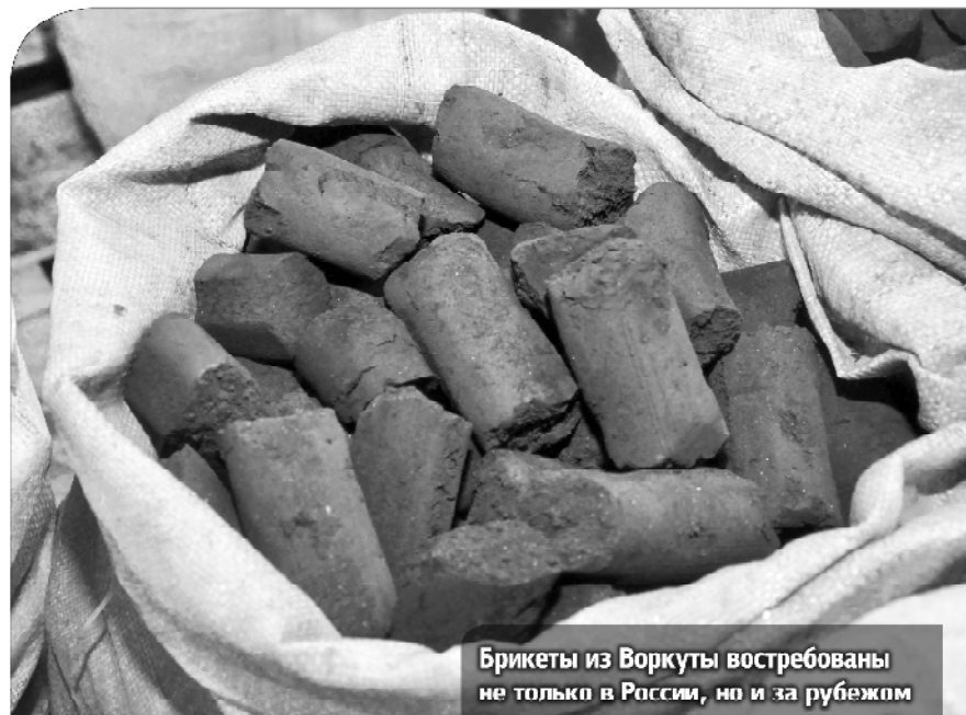
Брикеты из Воркуты востребованы не только в России, но и за рубежом

«Именно такого рода проекты - эффективные, самодостаточные, имеющие большой спрос в России в условиях импортозамещения, позволяющие уйти от сырьевой модели экономики, - необходимо реализовывать при любых обстоятельствах», - подчеркнул Вячеслав Гайзер.