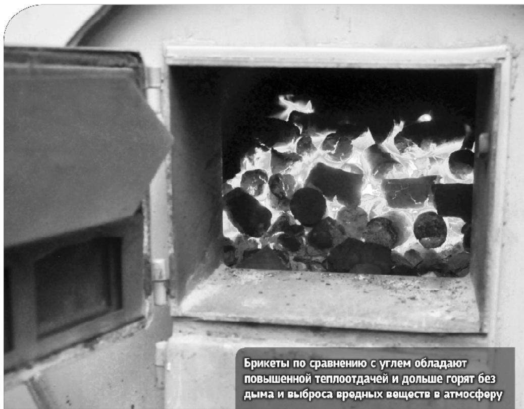
Брикеты по сравнению с углем обладают повышенной теплоотдачей и дольше горят без дыма и выброса вредных веществ в атмосферу