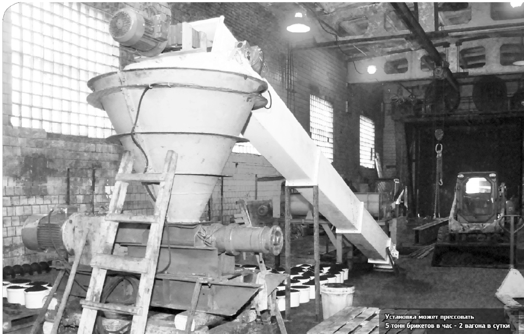
Установка может прессовать 5 тонн брикетов в час - 2 вагона в сутки