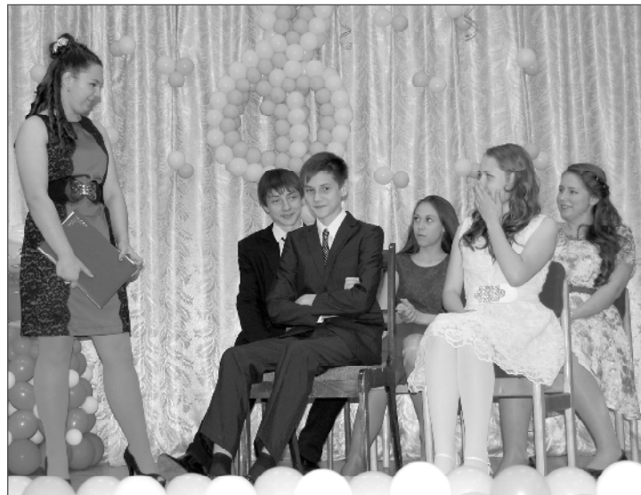
(Окончание. Начало на 2 стр.)

ром «В траве сидел кузнечик», в котором каждый играл на новом для него инструменте. Нужно отметить, что подготовка к этому выступлению проходила без помощи педагогов, выпускники сами обучали друг друга.